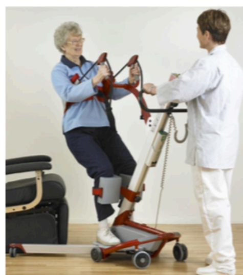
Percha en "U" (opcional)